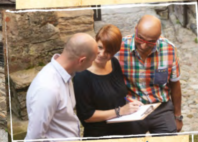
Wettbewerb in kleinen Gruppen