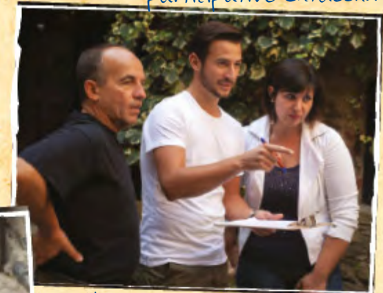
Stimulierung der Problemlösungsfähigkeiten