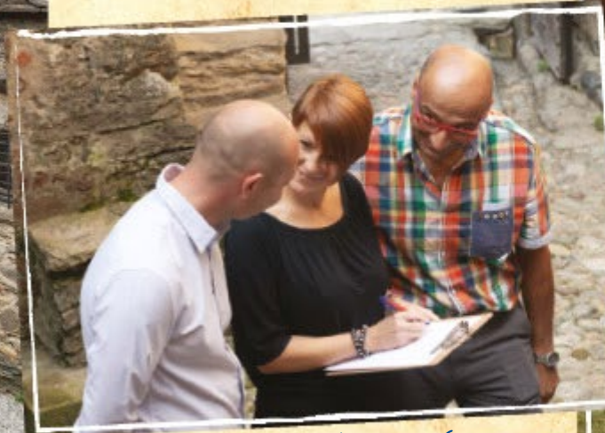
Wettbewerb in kleinen Gruppen