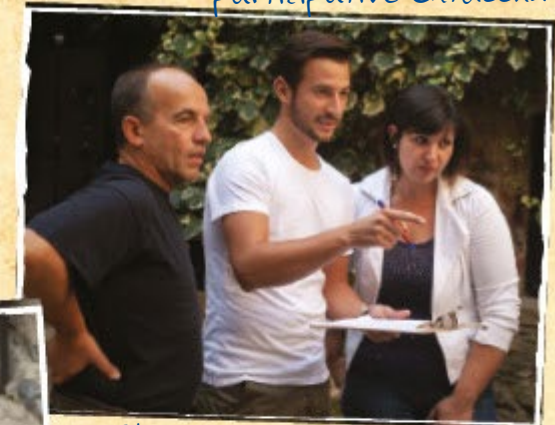
Stimulierung der Problemlösungsfähigkeiten